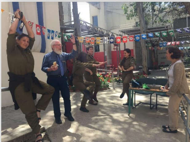
חברי צוות בית הפלמ"ח ביום העצמאות

בתמונה משמאל: מבקרים סינים ביום הזיכרון יחד עם צבי הפלמ"חניק ב"אוצר התמונות"