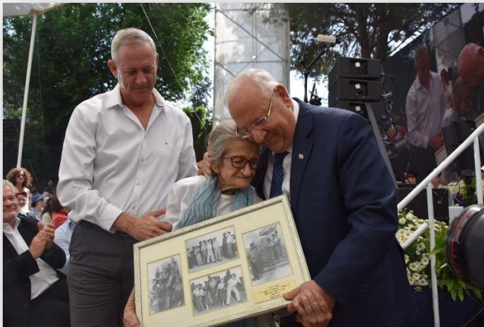
נשיא המדינה, נעמי פולני, הרמטכ"ל לשעבר בני גנץ (גם הוא בן של פלמ"חניק).