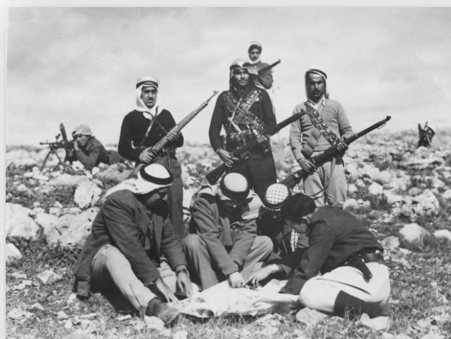
בתמונה: עבד אל-קאדר וחייליו, ביום הקרב.