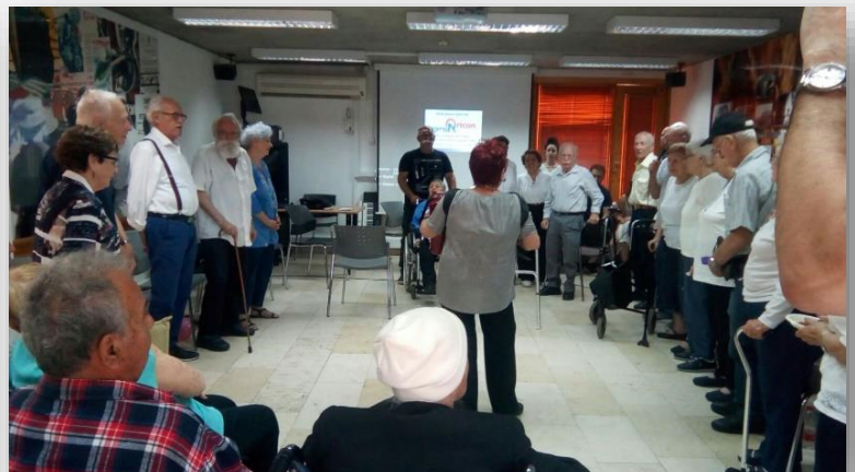
חברי ההכשרות שרים יחד את שיר הפלמ"ח